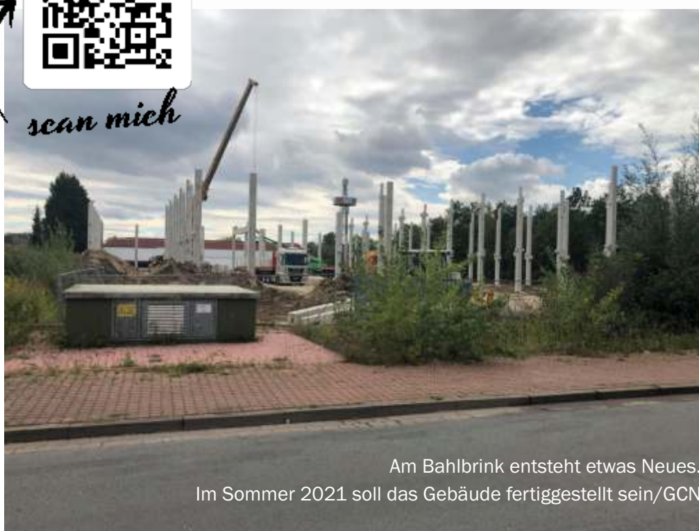
Am Bahlbrink entsteht etwas Neues. Im Sommer 2021 soll das Gebäude fertiggestellt sein