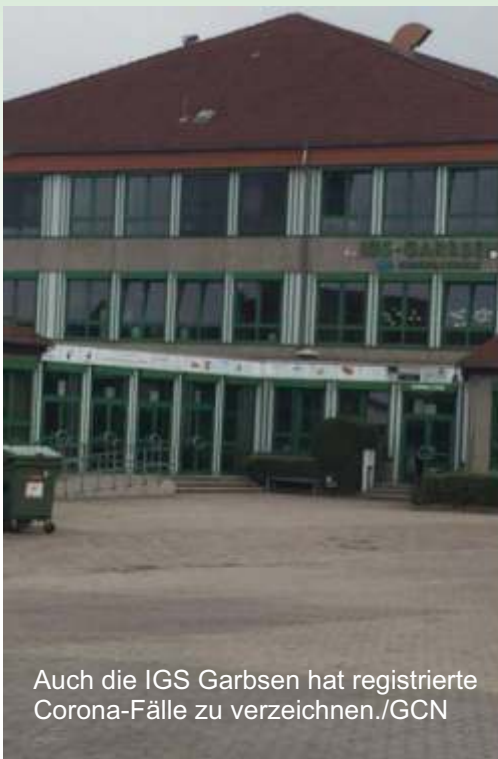
Auch die IGS Garbsen hat registrierte Corona-Fälle zu verzeichnen.