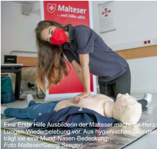
Eine Erste Hilfe Ausbilderin der Malteser macht die Herz-Lungen-Wiederbelebung vor. Aus hygienischen Gründen trägt sie eine Mund-Nasen-Bedeckung.