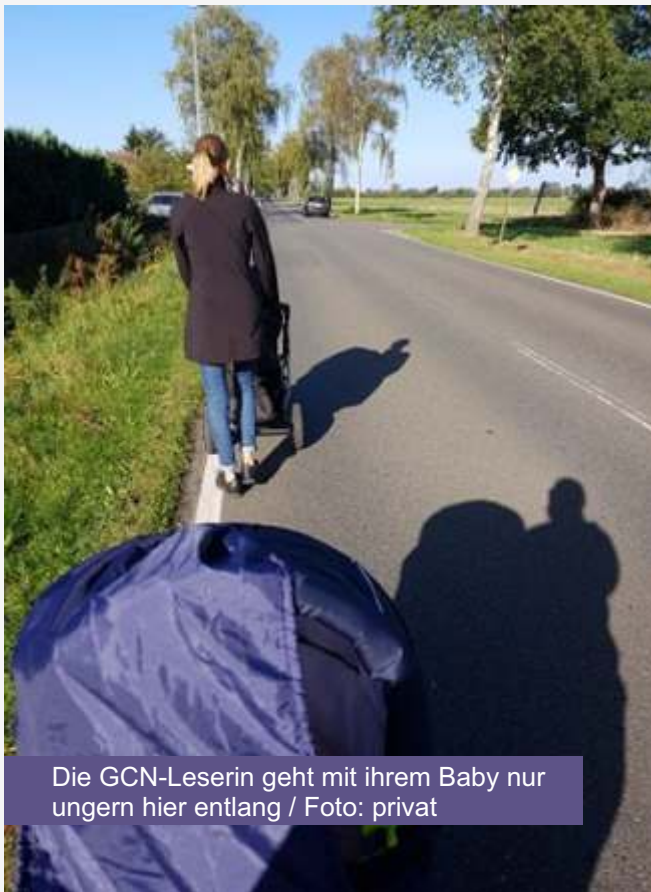
Die GCN-Leserin geht mit ihrem Baby nur ungerne hier entlang