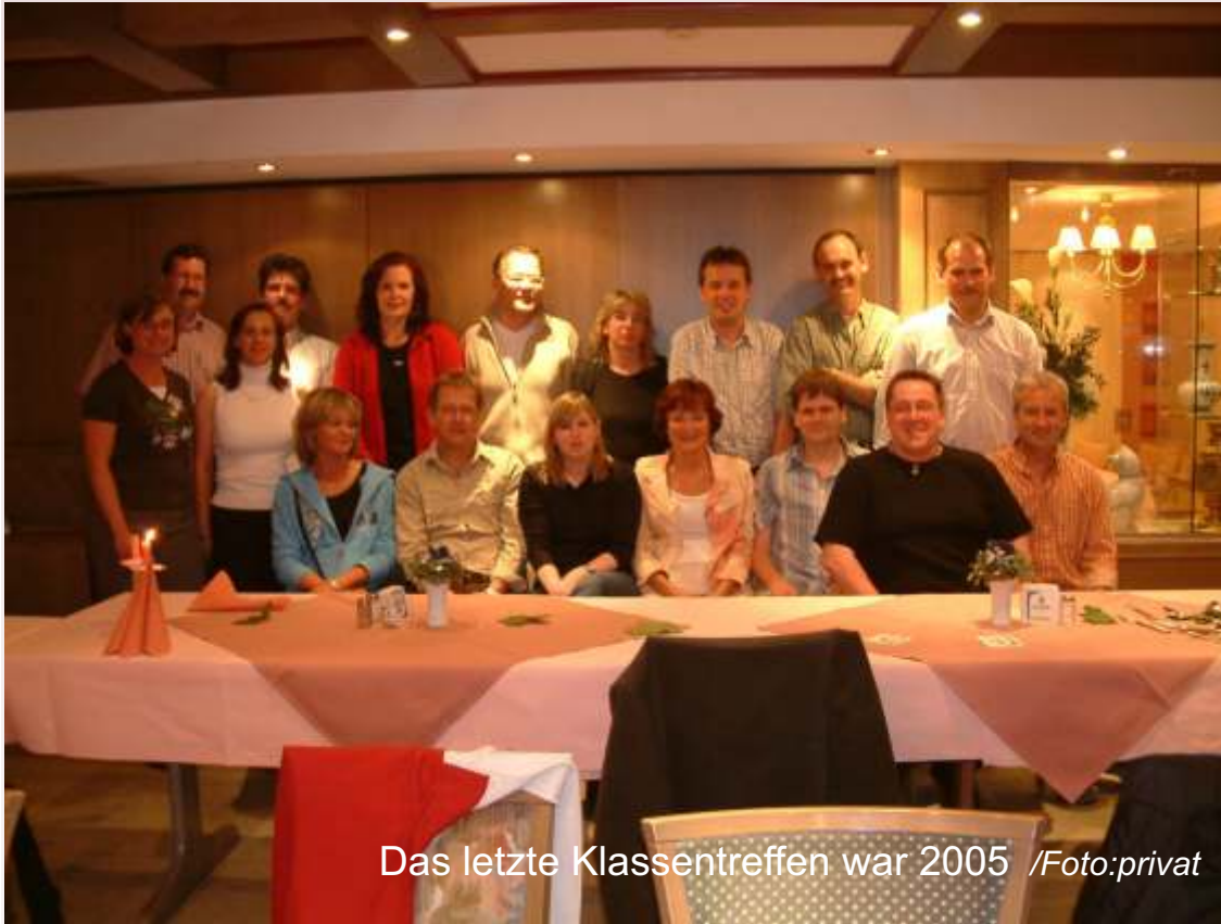
Das letzte Klassentreffen war 2005

Ehemalige IGS-Schüler suchen Klassenkameraden für erneutes Klassentreffen