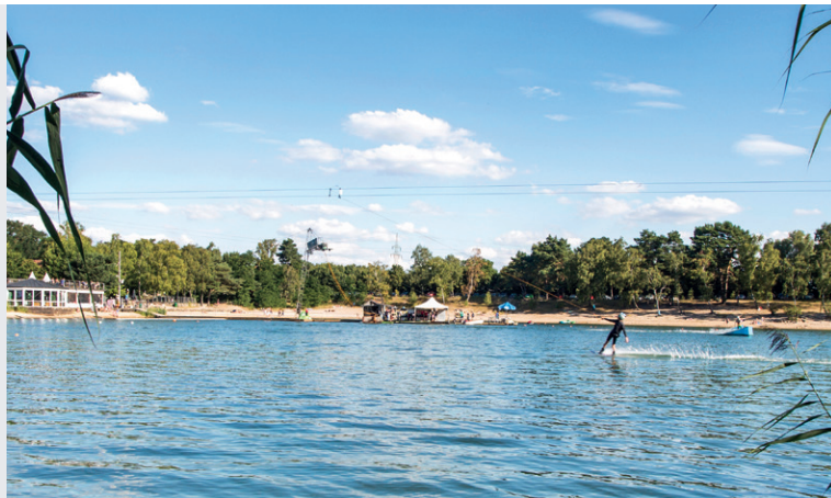
Der Blaue See

Besuchen Sie die beeindruckende Barockkirche Schloss Ricklingen, ein architektonisches Juwel, das mit seiner prachtvollen Fassade und den kunstvollen Innenräumen begeistert. Tauchen Sie ein in die Geschichte und lassen Sie sich von der Atmosphäre dieses historischen Ortes verzaubern.