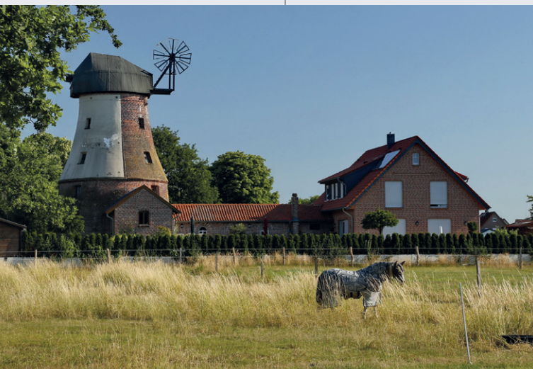
Die Horster Mühle

Das hochherrschaftliche Rittergut Heitlingen ist umgeben von einer liebevoll restaurierten Parkanlage, liegt ebenfalls malerisch auf der Route des Garbsener Radrings. Es begeistert mit seinem charmanten Ambiente, einer faszinierenden Geschichte und lädt zum Spaziergang durch gepflegte Gärten ein. Das Gut führt seine Geschichte auf das seit 1386 nachweisbare adelige Gut Hetlage zurück und war einst im Besitz der Familie von Limburg. Der zugehörige Grundbesitz