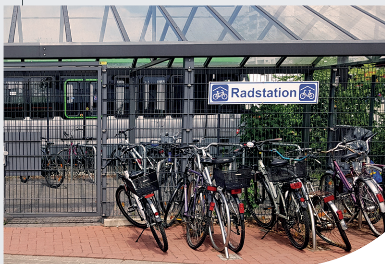
Radstation an der Stadtbahnhaltestelle Garbsen

Inhaber von Monatskarten können sich gegen ein Pfand einen Schlüssel für die Radstation an der Endhaltestelle der Stadtbahn im Rathaus, Abteilung Verkehr und Straßenbau geben lassen.